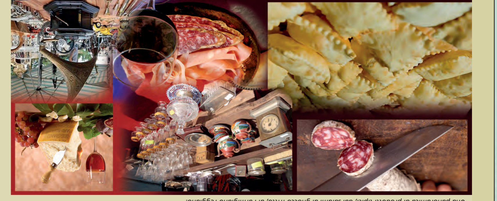
Una panoplia di prodotti tipici, dai salumi al grucco fritto, al parmigiano-reggiano